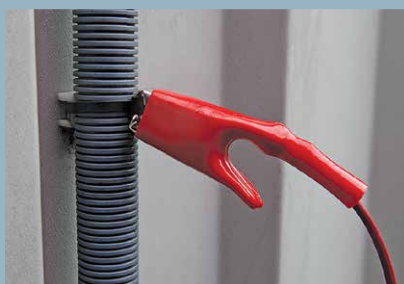
Techniques de suivi du tracé des câbles de petit diamètre