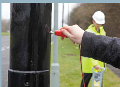
Aimant puissant en néodymium

Les accessoires des Genny3 sont compatibles avec les accessoires Genny4 Pour de plus amples informations sur la large gamme d'accessoires disponibles, veuillez contacter votre bureau Radiodetection local ou visiter notre site www.radiodetection.com